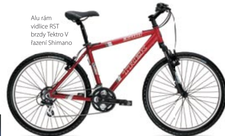
Alu rám vidlice RST brzdy Tektro V řazení Shimano

Autorizovaný prodej jízdních kol Garry Fisher, Specialized, Kona, Trek... Specializovaný servis odpružení a kotoučových brzd. Modřanská 51, Praha 4 – Podolí, tel.: 244 466 473, mob. 777 827 399 krabcycles@seznam.cz, www.krabcycles.cz